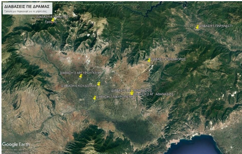
Χάρτης 3: Σημειακός χάρτης πρότυπων διαβάσεων, Π.Ε. Δράμας