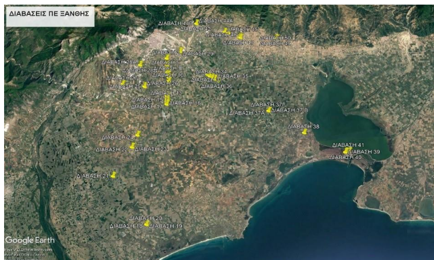
Χάρτης 1: Σημειακός χάρτης πρότυπων διαβάσεων, Π.Ε. Ξάνθης

Στους χάρτες που ακολουθούν, αποτυπώνονται γεωχωρικά οι θέσεις των προς αναβάθμιση διαβάσεων.